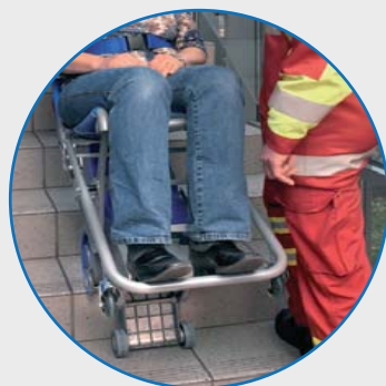
Ideale per scale ripide e strette

**Ideale per ambulanze e mezzi di trasporto disabili