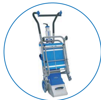
Compatto quando non lo utilizzate