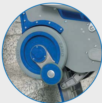
Freni resistenti, automatici e affidabili